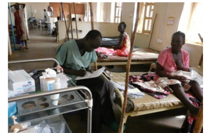
V nemocnici v Aweilu.

Další blogy Veronicy najdete na www.jsem-v-tom.cz .