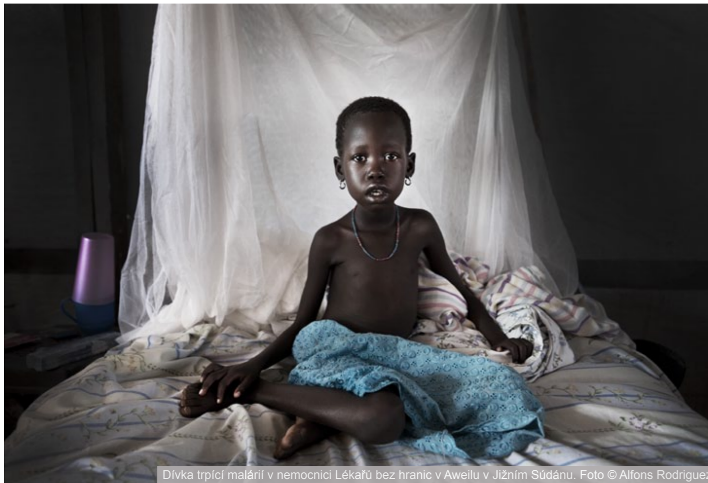
Dívka trpící malárií v nemocnici Lékařů bez hranic v Aweilu v Jižním Súdánu.