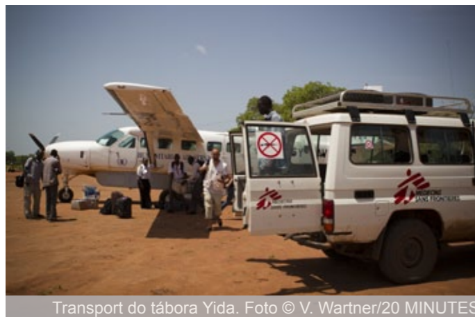
Transport do tábora Yida.

přírodními podmínkami a nedostatečnou výživou je proto rozsah nemocí poměrně široký. Nejčastěji léčíme různé druhy průjmů (krvavých i nekrvavých), infekce horních cest dýchacích, tuberkulózu nebo všudypřítomnou malárii. Stejně tak se často setkáváme se zraněními způsobenými nevybuchlou municí, které je v Nubijských horách víc než dost. Běžnou podvýživou léčí na místě partnerské organizace. My se zaměřujeme na komplikovanější případy, např. při kombinaci podvýživy a malárie nebo silného průjmu. Proočkovanosť populace je velmi nízká a u mnohých ročníků nulová – u dětí se proto objevují spalničky, které mohou v místních podmínkách přejít do epidemie. V takových podmínkách se vždy snažíme provádět masové očkovací kampaně zahrnující ty nejohroženější skupiny. Zde se nám podařilo naočkovat 14 000 dětí ve věku od 6 měsíců do 15 let. Kromě toho očkujeme při vstupní registraci všechny děti přicházející do tábora.