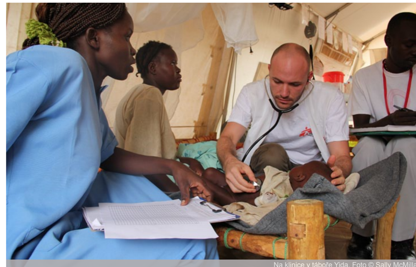
Na klinice v táboře Yida.

Lékaři bez hranic jsou nástroj, skrze který se dá pomoci mnoha neznámým lidem ve vzdálených místech. Dostanete se do situací, které prověří vaše fyzické i psychické schopnosti. Ale pořádk, pořádk budete mít za sebou kolegy připravené vám pomoci nebo poradit. Obecně je to zajímavá práce pro ty, které přitahují rozdílná kulturní, politická a společenská prostředí. Je to práce, u které není nutné se ptát, proč to vlastně dělám – odpověď na tuhle otázku máte před očima každý den.